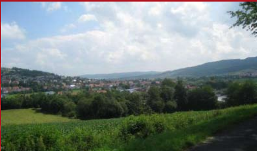
Blick auf Niederaula